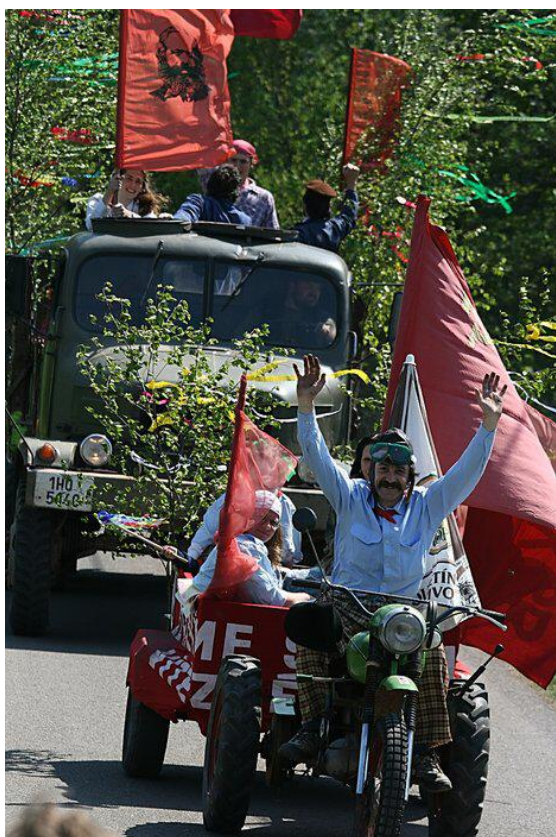
MF CUP 2009