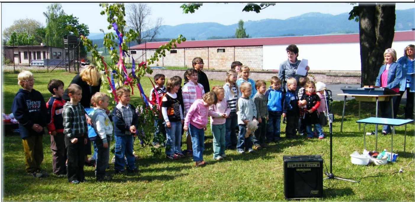
Besídka ke Dni matek jako malá zahradní slavnost