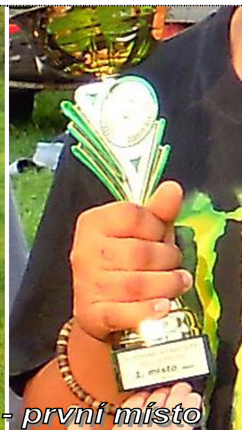
Mladí hasiči na soutěži - první místo