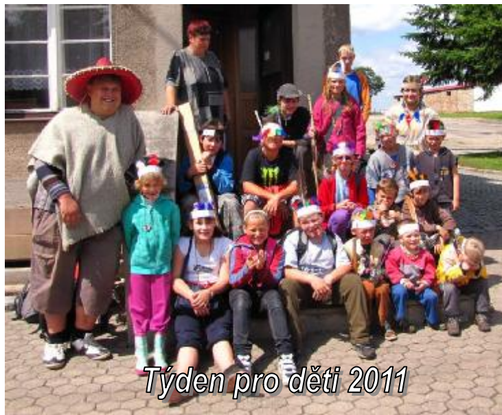
Týden pro děti 2011