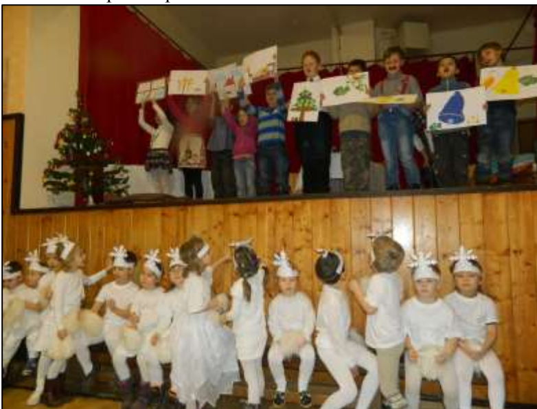
Vánoční besídka ZŠ a MŠ