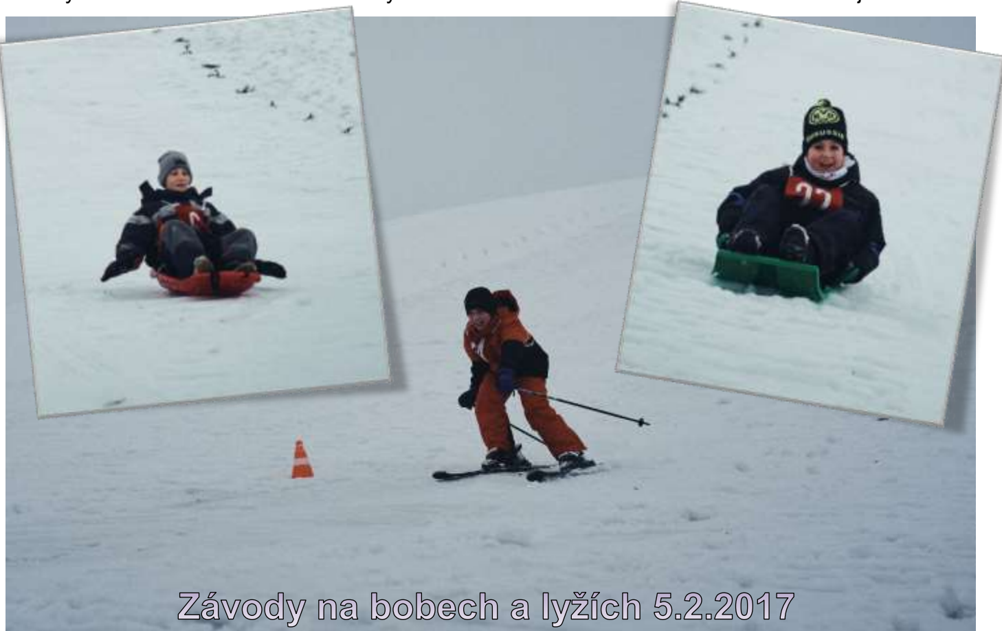
Závody na bobech a lyžích 5.2.2017