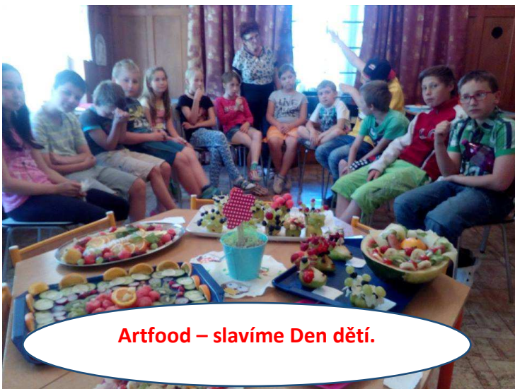
Artfood – slavíme Den dětí.