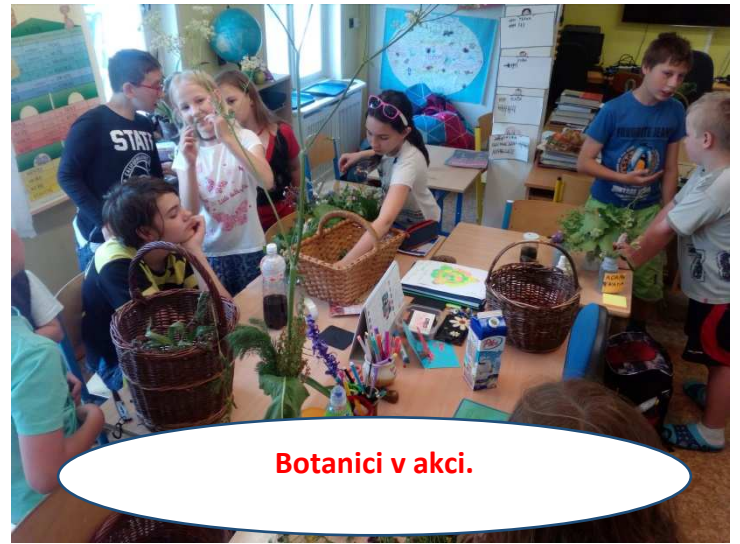
Botanici v akci.