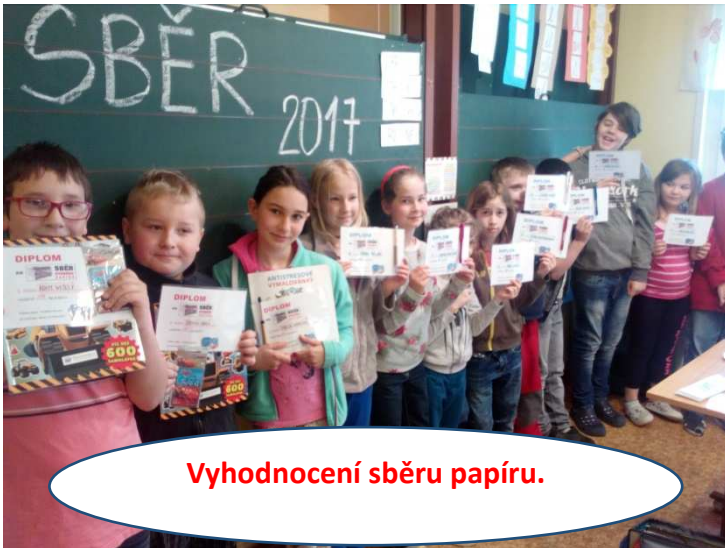
Vyhodnocení sběru papíru.