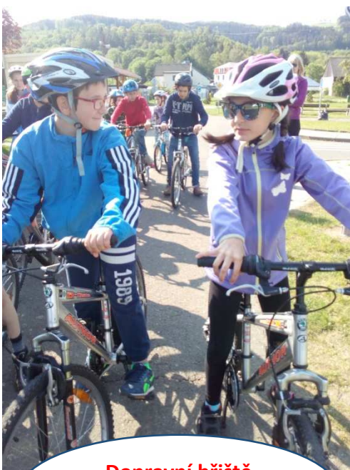
Dopravní hřiště v Náchodě.