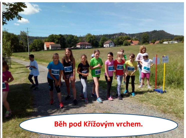
Běh pod Křížovým vrchem.