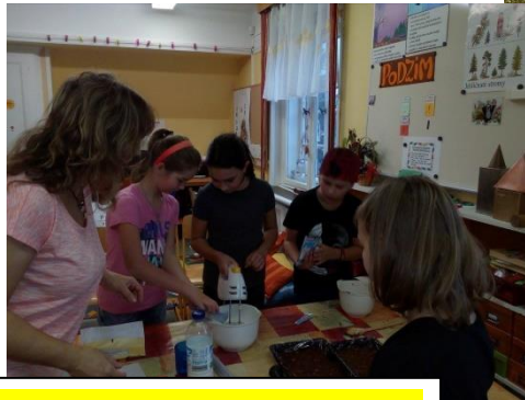
Příprava na Jetřichovskou buchtu.