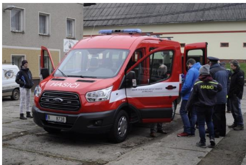
Nový dopravní automobil pro JSDH Jetřichov