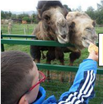
Adaptační výlet na farmu Wenet.