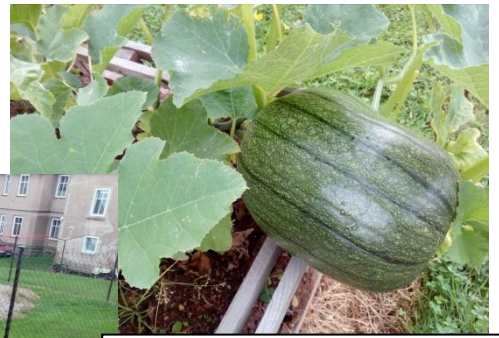
Sklízíme podzimní plody